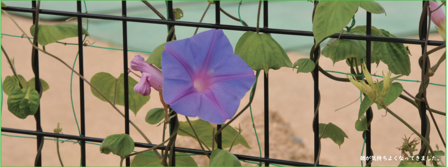
朝が気持ちよくなってきました。